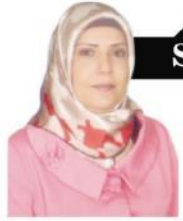
Haber: Songül DURSUN

Ankara'da faaliyetlerini gösteren Kültür ve Tanıtma Vakfı tarafından yılda iki defa yayımlanan Elazığ dergisinin Ocak 2019 50. sayısı yayımlandı. '2023 Harput Yılı' konu başlığı ile yayımlanan dergide MTA Genel Müdürü hemşehrimiz Cengiz Erdem 'in 'Ülkemizde Bir Cevher: Elazığ' başlıklı yazısı dikkat çekiyor. Erdem kaleme aldığı yazısında İlimizde geçtiğimiz haftalarda Cip Köyünde açılışı gerçekleştirilen Jeotermal kaynak suyunun İlimiz ve bölge açısından önemine değinerek "Bu kaynağa yapılacak termal tesisler ile Elazığ sağlık turizminde de yerini alacak ve bölgesinde cazibe merkezi haline gelecektir" ifadelerine yer verdi.