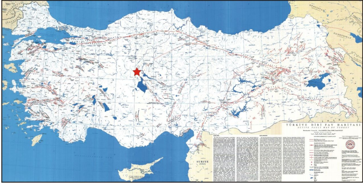
Şekil 2. 27 Aralık 2007 Bala (Ankara) Depremi'nin Türkiye Diri Fay haritası (MTA, 1992) üzerindeki yeri.