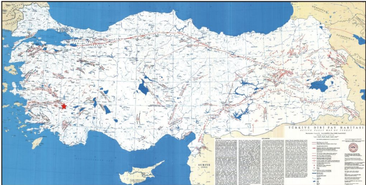
Şekil 2. 25 Nisan 2008 Honaz (Denizli) Depremi'nin Türkiye Diri Fay haritası (MTA, 1992) üzerindeki yeri.

25 Nisan 2008 tarihinde Honaz-Denizli'de meydana gelen depremin yeri Türkiye Diri Fay haritasına da konularak kaynak fay konusu değerlendirilmiştir (Şekil 2). Deprem, Türkiye Diri Fay haritasına göre Büyük Menderes Grabeni'nin doğu ucunda KB-GD uzanımlı normal fayların bulunduğu bir alanda meydana gelmiştir. Ancak, Türkiye Diri Fay Haritası'na göre bu büyüklükteki bir depremin kaynağı olabilecek fay hakkında yorum yapılamamıştır.