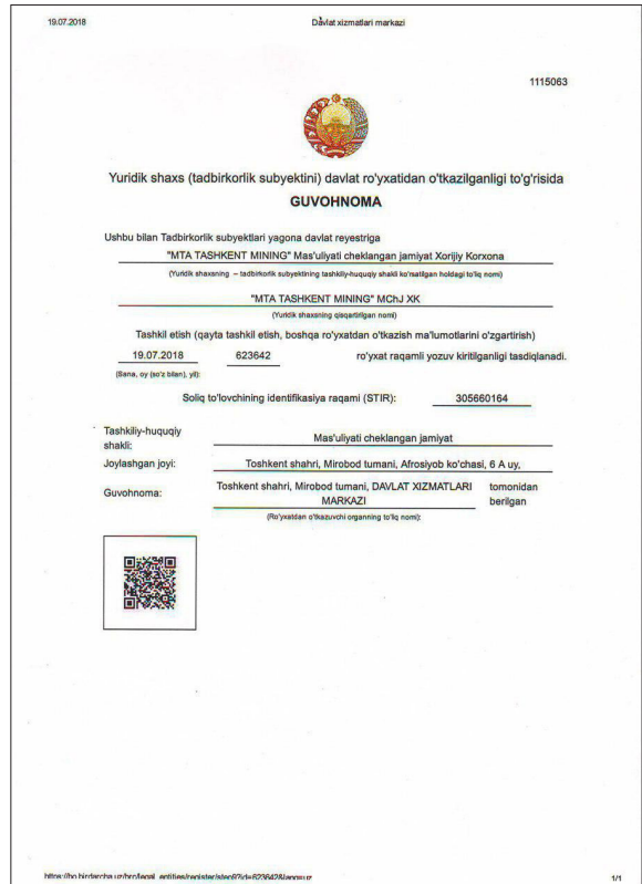
Şekil 5- MTA tarafından Özbekistan'da kurulan MTA Tashkent Mining şirketinin kuruluş sertifikası.