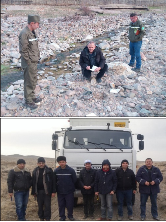
Şekil 7- MTA Tashkent Mining tarafından Özbekistan'da gerçekleştirilen arazi çalışmalarından bir görüntü.

personelin çalıştırılabilmesine / istihdamına imkân sağlanması gerektiği,