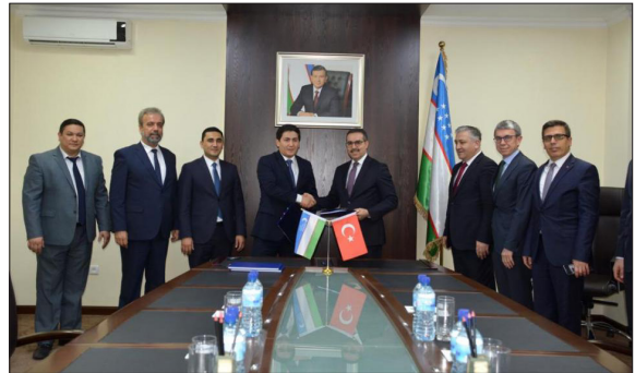
Şekil 6- MTA ile GOSCOMGEOLOGY arasında yürütülen müzakere sürecinden bir görüntü.