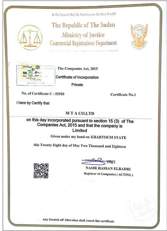
Şekil 2- MTA tarafından Sudan'da kurulan MTA Company Limited'in kuruluş sertifikası.

Yine, Sayın Cumhurbaşkanımız Recep Tayyip Erdoğan'ın 29 Nisan - 01 Mayıs 2018 tarihlerinde Özbekistan'a resmi ziyaretleri sırasında Genel Müdürlüğümüz ile Özbekistan Cumhuriyeti Jeoloji ve Maden Kaynakları Devlet Komitesi (GOSCOMGEOLOGY) arasında "Belirlenen Sahalarda Ortak Arama Projesi Uygulama Anlaşması" imzalanmıştır. İmzalanan anlaşmayla üç adet ruhsat sahası MTA adına bloke edilmiştir.