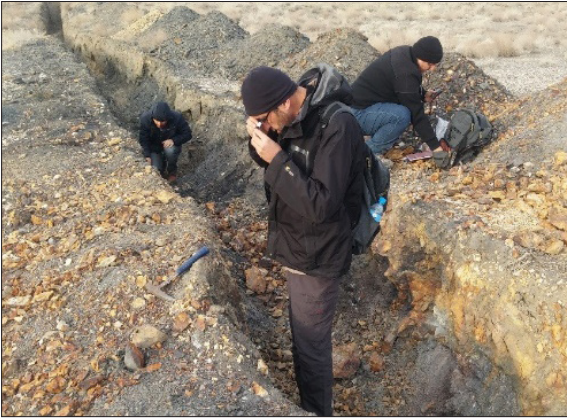
Şekil 4- MTA Company Limited tarafından Sudan'da gerçekleştirilen arazi çalışmalarından bir görüntü.

İmzalanan anlaşma kapsamında MTA Tashkent Mining şirketi tarafından, yukarıda belirtilen üç sahada maden kaynaklarının aranması amacıyla yapılan detay jeokimya ve havadan jeofizik etütleri tamamlanmış olup, uygun bulunan alanlarda sondaj çalışmaları yapılacaktır (Şekil 7).