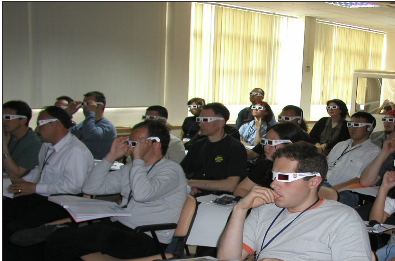
Şekil 1- MTA-JICA 3. Ülke Eğitim Programlarından bir görüntü.

Kurulduğu günden itibaren madencilik sektörüne rehberlik eden ve gerçekleştirdiği arama ve araştırma faaliyetleri ile ülkemizin gelişen sanayisinin artan enerji ve hammadde ihtiyaçlarının temini konusunda öncülük eden MTA'nın yurt içinde yürütmekte