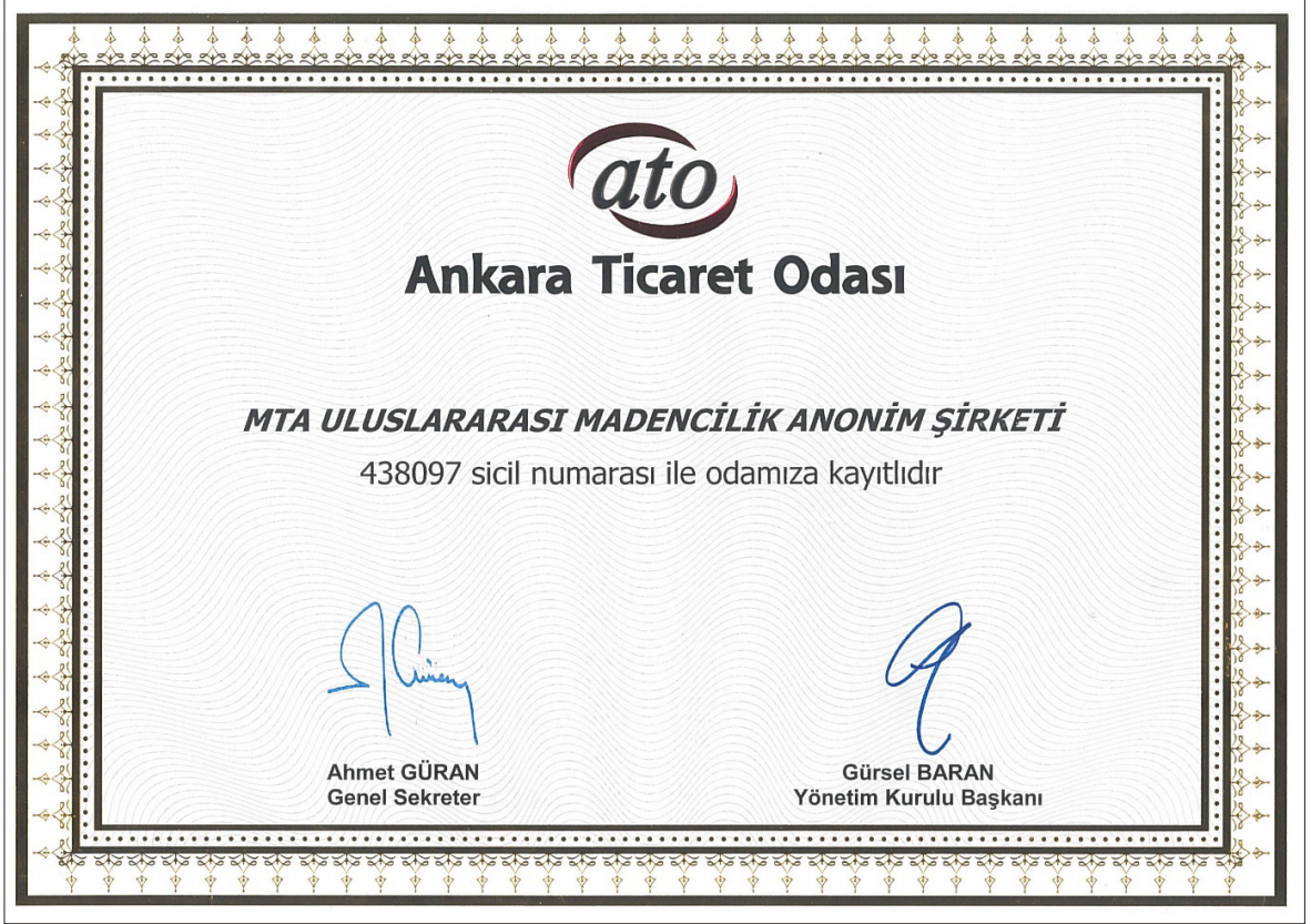
Şekil 8- MTA tarafından Ankara’da kurulan MTA Uluslararası Madencilik Anonim Şirketi’nin kuruluş sertifikası.

Türkiye İstatistik Kurumu, www.tuik.gov.tr