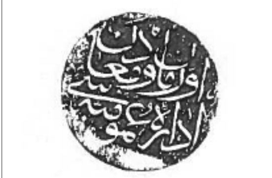
Şekil 4- Orman ve Maden Umum İdaresi yazılı mühür.

Orman Mektebi gibi Maden İdaresinde dahi bir maden mektebi tesis ve teşkil olunmalıdır. Madencilik fenninde geometri, hesap ve topoğrafya kısımları Padişahın sayesinde askeri mekteplerde bulunan subaylardan bir iki zat; jeoloji ve taşların tarifi, kimya ve izabeden ibaret bulunan madencilik kısmı dahi oldukça Türkçeye aşina bulunan adı geçen Mühendis Mösyö Weiss ve Mösyö Deröz taraflarından tedris edilmesi kabul olunmuştur. Şu halde zikredilen mektepten iki sene zarfında madenlerde istihdam olunabilecek uygun nitelikte ikinci derecede mühendisi yetiştirilecektir. İleride bunlardan Avrupa fen okullarına gönderilenler pek az vakit içinde fenlerini tamamlayacakları anlaşılmıştır. İş bu mektebin teşkili, bir çok maaş ve gereksiz masraflara tutulmayıp, tahmin edilen masrafı senevi on beş bin kuruştan ibaret bulunmuş olmakla Bakan Hazretlerine bildirildiği halde keyfiyetin hükümete arz buyrulması konusunda emir ve ferman, emir verenindir. Tarih 11 Aralık 1873 Mühür (Şekil 4) (Orman ve Maden Genel İdaresi)