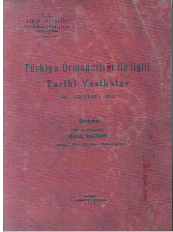
Şekil 1- Halil Kutluk’un Tarihi Vesikalar derlemesi.

İkinci belge; birinci yazıya istinaden Sadrazam Makamından Padişah Makamına Madencilik Mektebi açılmasına yönelik izin istenmesi hususunda ferman yazılması için 2 Şubat 1874 tarihli arz yazısıdır.