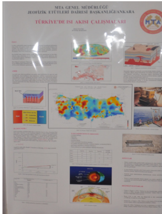
Şekil 1- Jeofizik Etütleri Dairesinin yaptığı çalışmalar sözlü ve poster sunumları

Kongreye başta yabancı firmalar olmak üzere, 22 firma yer almış olup; katılımcılara kullanılan ekipman, yazılım ve gelişen teknoloji ile ilgili bilgiler verilmiştir. Bilimsel Dokü-