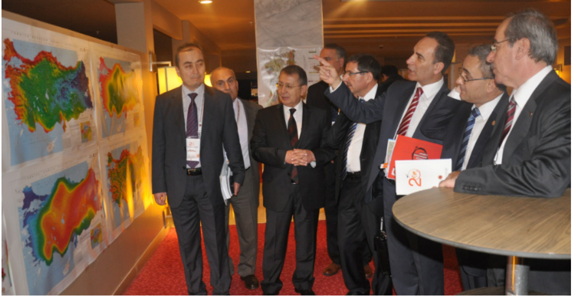
Şekil 2- Kongrede başta yabancı firmalar olmak üzere, 22 firma yer almıştır.

Ülkemiz gündemini son yıllarda meşgul eden "Afet Riski Altındaki Alanların Dönüştürülmesi (kentsel dönüşüm) Kanunu ve Uygulama Yönetmeliği"nin tartışıldığı "Kentsel Dönüşüm: Yasa, Uygulama, Güçlükler ve Öneriler" başlıklı panel gerçekleştirilmiştir. Bu panele siyasetçiler ve bilim adamları panelist olarak katılmış olup ve konu bütün boyutlarıyla tartışılmış, önemli sonuçlara varılmıştır.