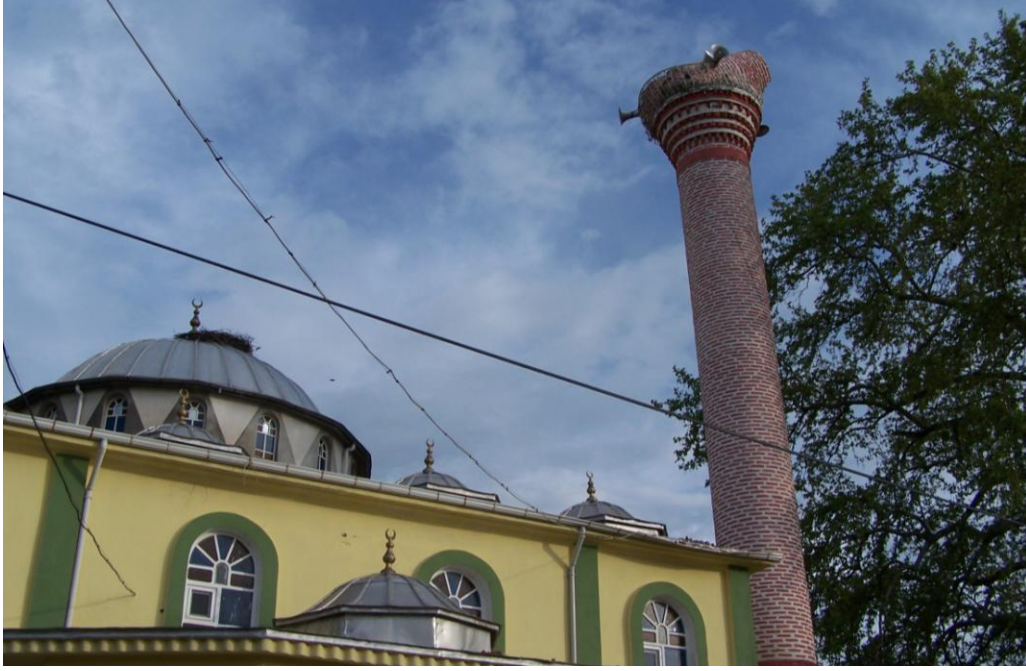
Şekil 8. Cami minaresinde gelişen hasar.