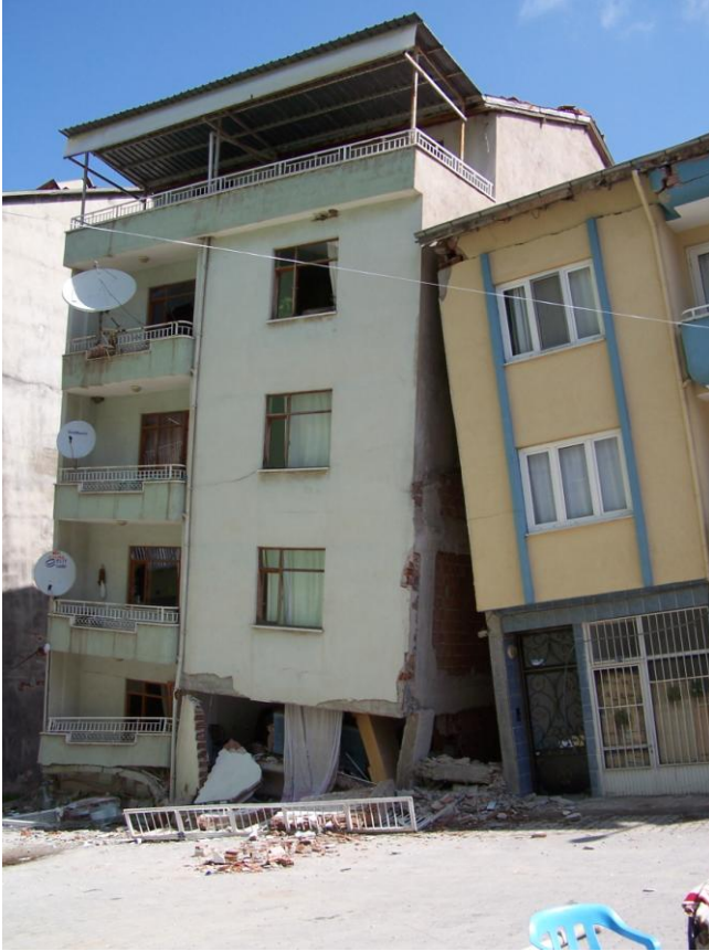
Şekil 9. Simav'da ağır hasarla yıkılan betonarme bina