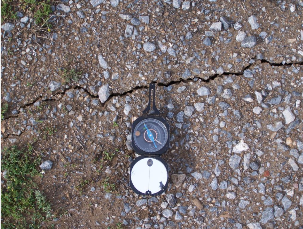
Şekil 5. Eynal-Karacaören asfalt yolunda gözlenen kılcal çatlakların yakın görünüşü, bakış güneye.