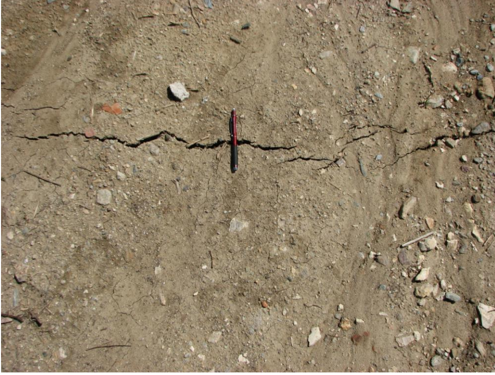
Şekil 6. Eynal kaplıcası batısında toprak dolgu alanında gözlenen kılcal çatlaklar, bakış güneye