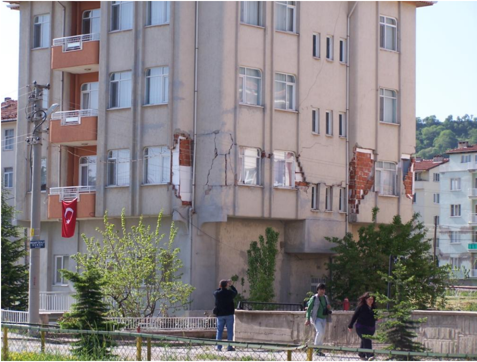
Şekil 7. Simav doğu girişinde betonarme çok katlı binada gelişen hasarlar.