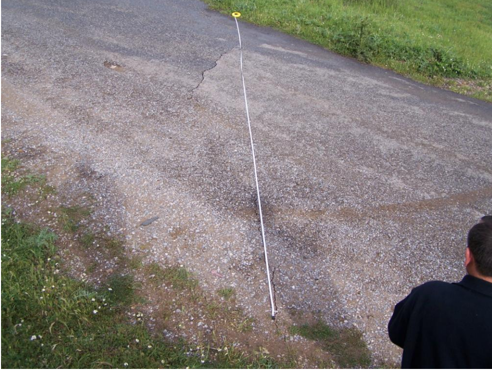
Şekil 4. Eynal-Karacaören asfalt yolunda gözlenen kılcal çatlaklar, bakış doğuya