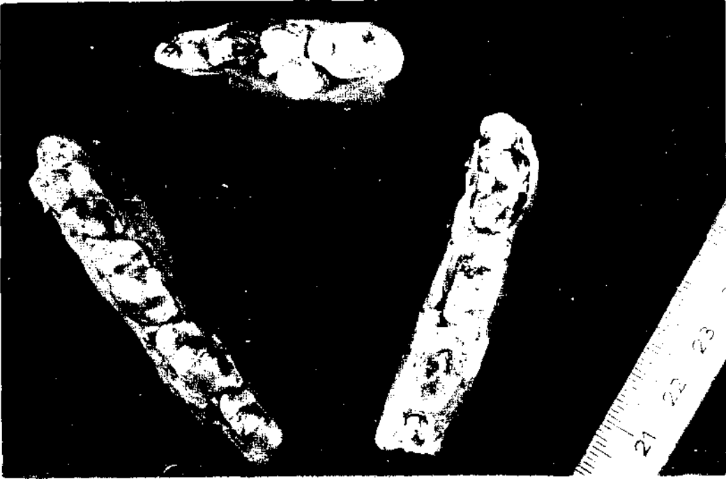
Şek. 1 - Kınıkta'ki Ictitherium hipparionum GERVAIS üst ve alt çene dişlerinin üstten görünüşü.