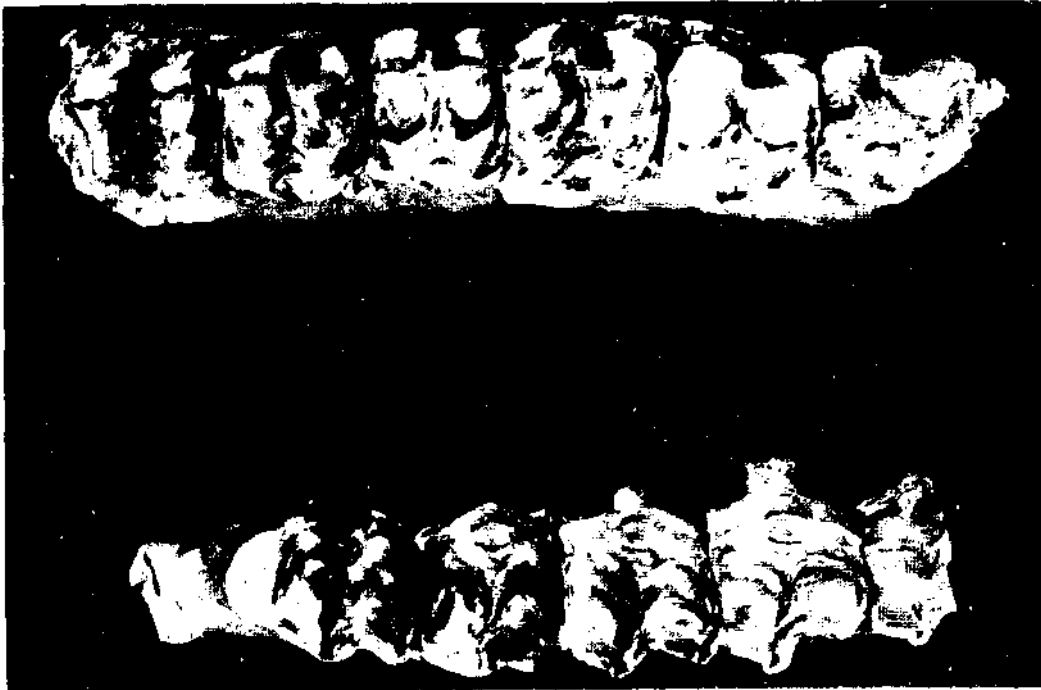
Şek. 2 - Kınıkta'ki Hipparion gracile de CHRISTOL üst çene dişlerinin üstten görünüşü.