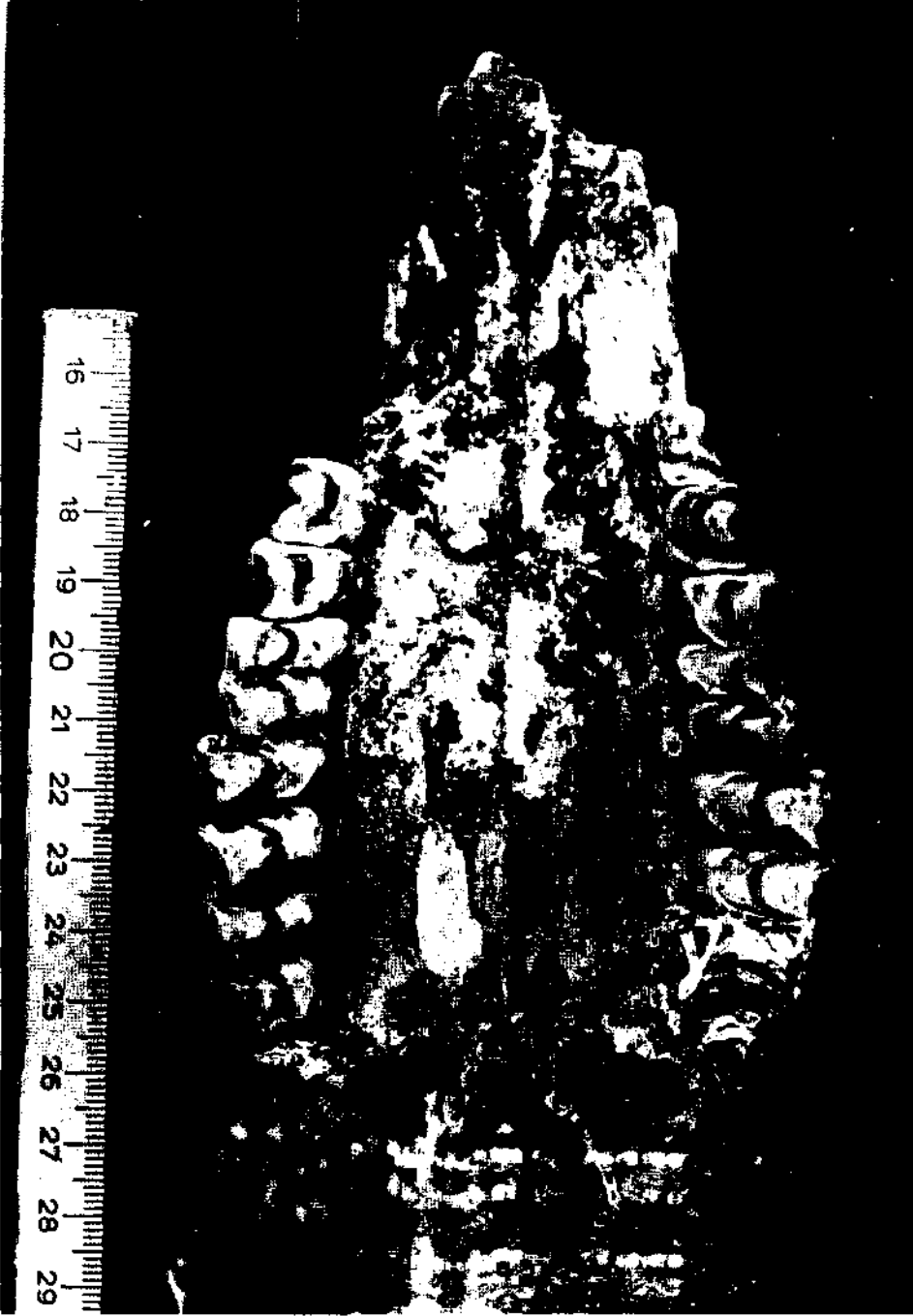
Kınıkta'ki Protoryx carolinae MAJOR üst çene dişlerinin üstten görünüşü.