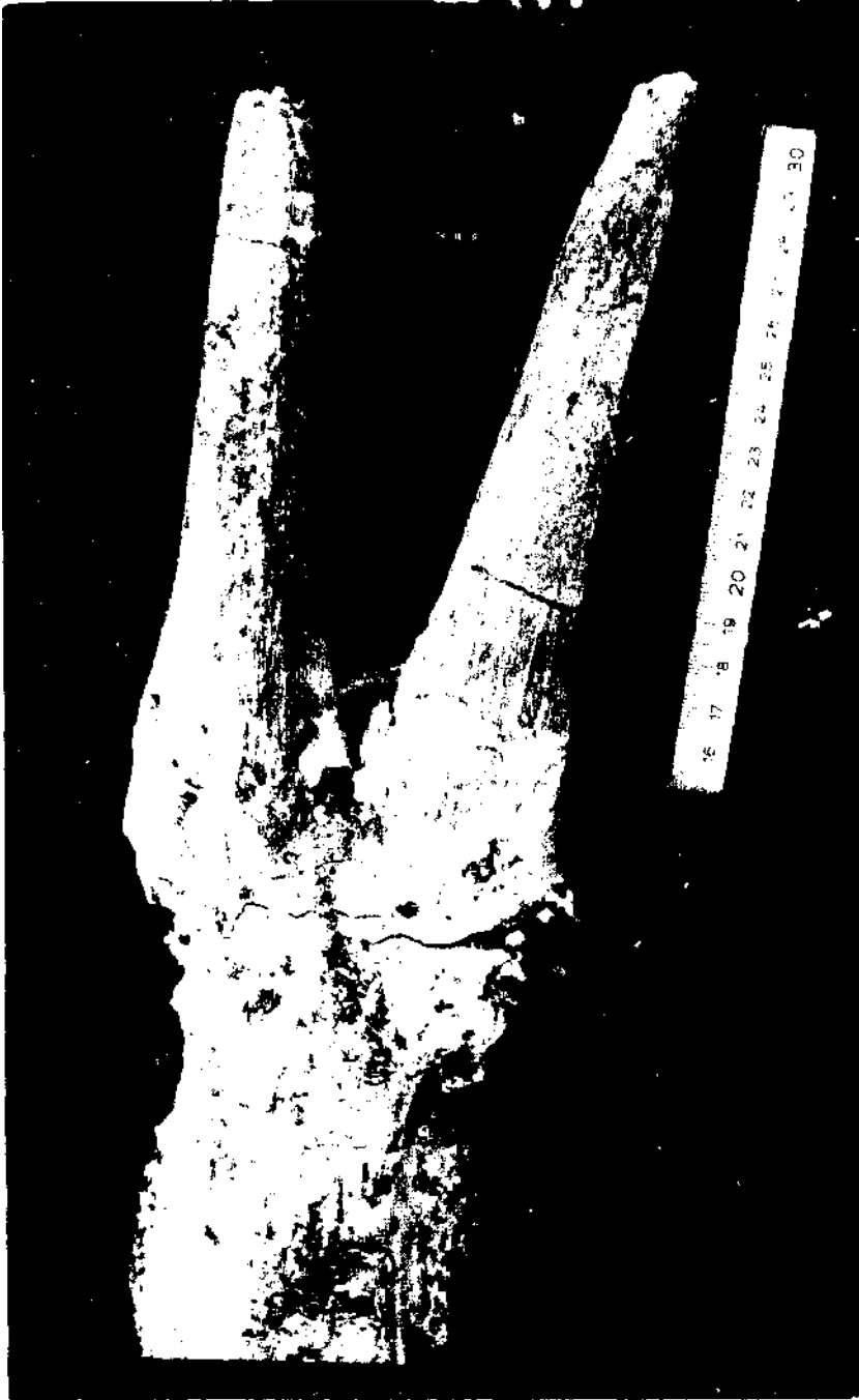
Kınıkta'kı Protoryx carolinae MAJOR boynuzunun önden görünüşü.