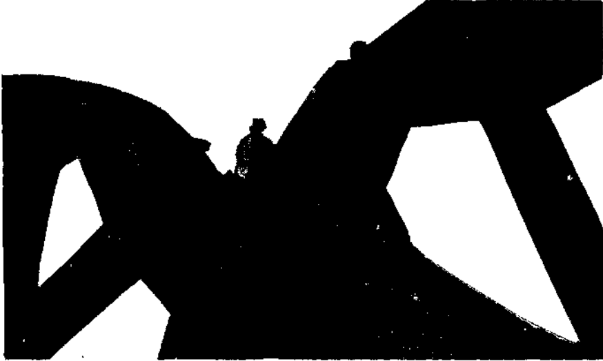
Basabirin sondaj makinesinin vinçlerinden biri (Bull Wheel) sistemi