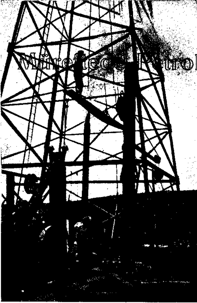
Mürettebde gaz feveran ederken